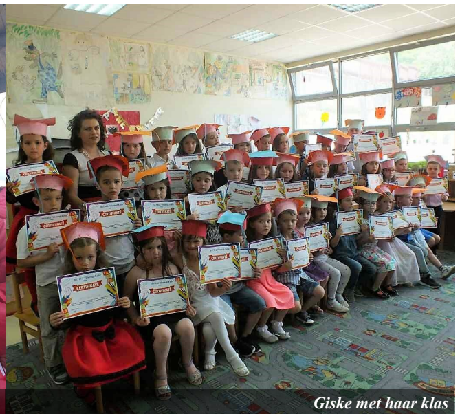
Giske met haar klas