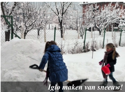
Iglo maken van sneeuw!