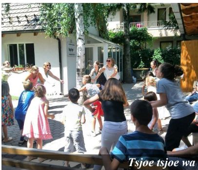
Tsjoe tsjoe wa