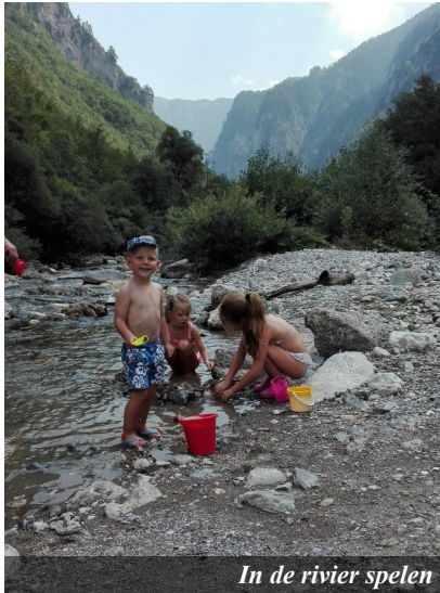
In de rivier spelen

In de nieuwsbrief voor de grote mensen staan ook altijd dingen om voor te bidden en voor te danken. Willen jullie ook bidden voor ons? Soms vinden we het nog best lastig dat we niet zomaar even langs opa en oma kunnen gaan, of kunnen spelen bij onze Nederlandse vriendjes en vriendinnetjes, of dat dingen hier in Kosovo heel anders gaan, vooral op school. Toch zijn we ook heel blij met zoveel leuke buurtkinderen, de fijne kerk en de postbus die heel vaak gevuld is. Willen jullie hier ook allemaal voor danken? En willen jullie er vooral voor bidden dat we een Lichtje zullen zijn voor de kinderen om ons heen, dat we Gods liefde mogen uitstralen door alles wat we doen en zeggen?