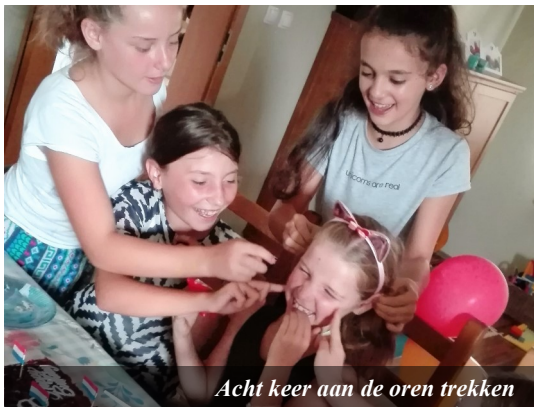
Acht keer aan de oren trekken

De watervallen vind ik heel leuk, omdat hier ook mooie grotten bij zitten. Daar is het lekker koel binnen, terwijl het hier in de zomer snikheet is. De bruiloften hier in Kosovo vind ik ook heel leuk, omdat de bruid en de bruidegom gaan dansen. En ik houd heel veel van dansen. De krekels vind ik niet leuk, die maken heel veel lawaai 's avonds in de zomer en er zat er zelfs een keer eentje op mijn nachtkastje! Ik vind het niet leuk dat er geen bos is hier in Kosovo, dat vond ik in Nederland zo fijn om doorheen te wandelen of te fietsen. Ik leer nu lezen en schrijven in het Kosovaars (op de Kosovaarse school) én in het Nederlands (op het thuishoortje). Het is soms best moeilijk om dit in twee talen te moeten leren. Ook is het jammer dat al mijn Nederlandse vriendinnetjes zo ver weg wonen, want daar heb ik zoveel plezier mee gehad tijdens het verlof. Ik vind de sneeuw hier in Kosovo erg mooi en vind het leuk om hier in de winter mooie dingen van te maken. En ik vind het mooi dat we de zondagschool hebben in de kerk met veel leuke liedjes om te zingen.