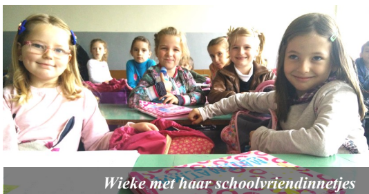
Wieke met haar schoolvriendinnetjes