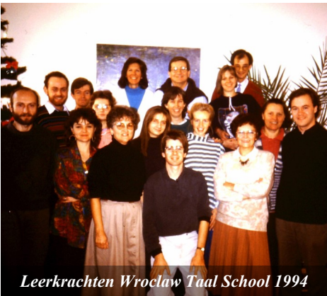
Leerkrachten Wroclaw Taal School 1994