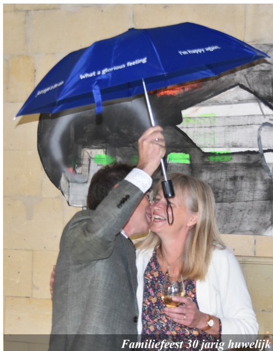
Familiefeest 30 jarig huwelijk

Een andere foto is die van de verhuisauto. We gingen een jaar naar All Nations Bible College, in Ware, Engeland. Daar hebben we opnieuw een jaar gestudeerd voordat we naar Maastricht gingen. Wat we daar geleerd hebben kunnen we ook nu toepassen in ons werk. Aan de muur hangt ook een rij met familiefoto's. Veel van deze foto's maakten we voor onze nieuwsbrieven. Wat een voorrecht om al negenentwintig jaar mensen om ons heen te hebben die voor ons bidden en die ons bemoedigen. Sommigen ondersteunen ons financieel al bijna 30 jaar. Heel veel dank hiervoor.