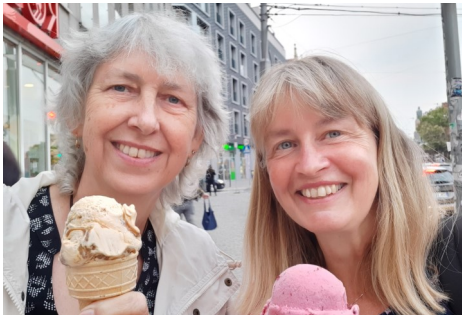
Oud collega Taalschool wroclaw Op bezoek september 2021 (bid voor herstel van hartbeschadiging door chemo)