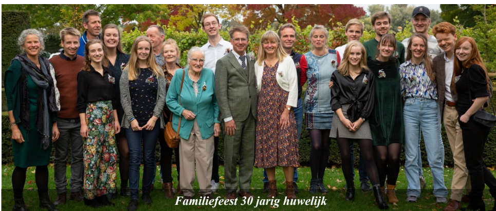
Familiefeest 30 jarig huwelijk