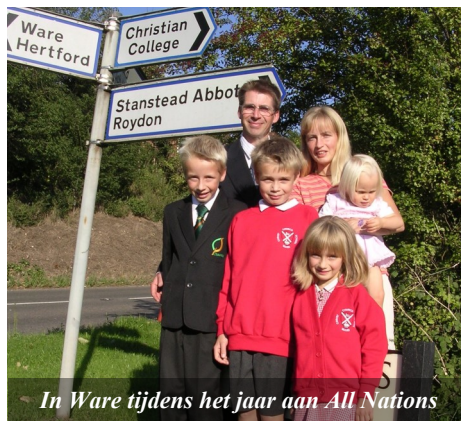
In Ware tijdens het jaar aan All Nations