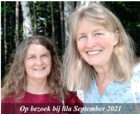
Op bezoek bij lila September 2021